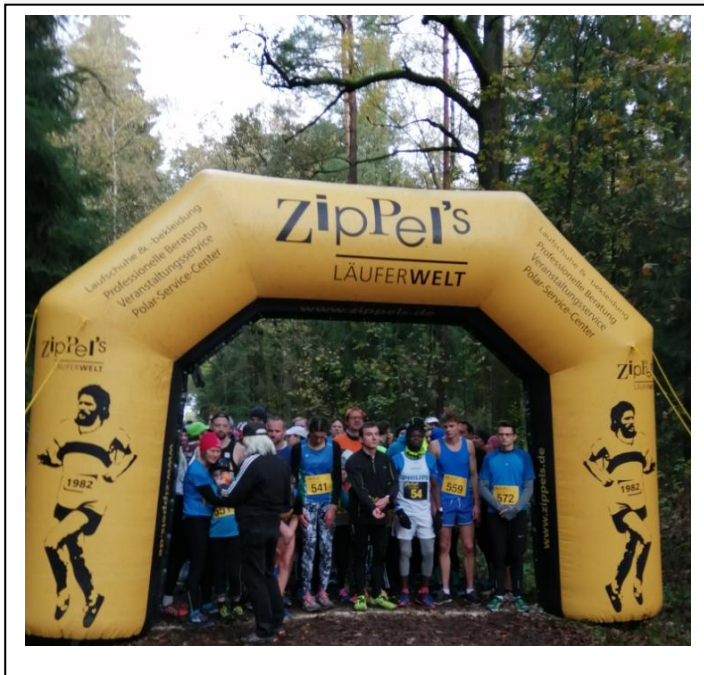
Sponsor Zippels Startbogen

sich engagiert für eine Beibehaltung dieser Veranstaltung auch in den kommenden Jahren aus und zeigten sich erfreut, als sie hörten, dass bereits im Rahmenterminplan 2020 der Waldlauf für den Sonntag, 1.11.20 eingetragen ist.